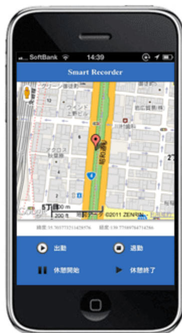
< 勤怠打刻画面 >