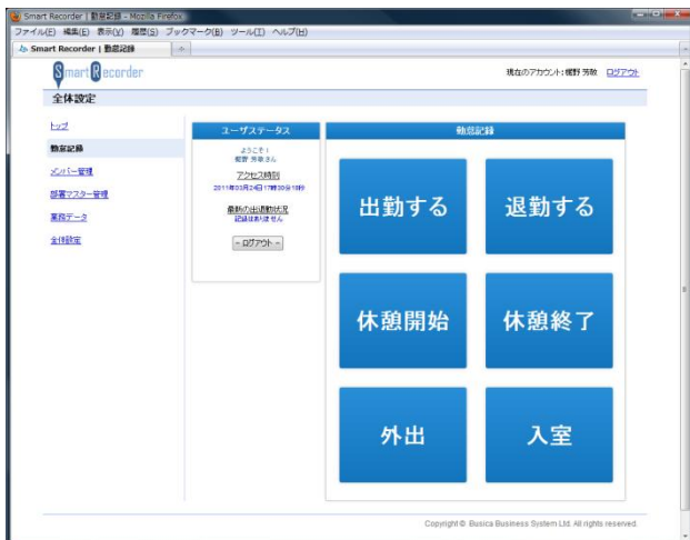
< PC (WEB ブラウザ) 打刻画面 >