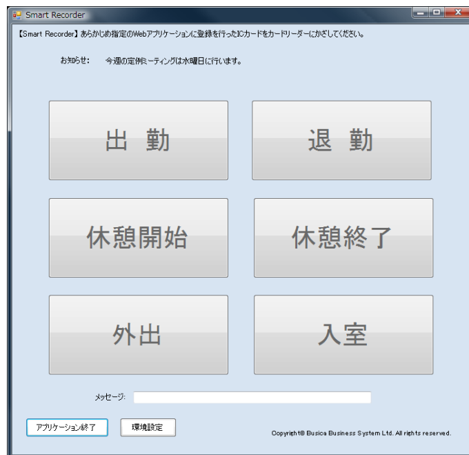
< IC カード認証打刻画面 >