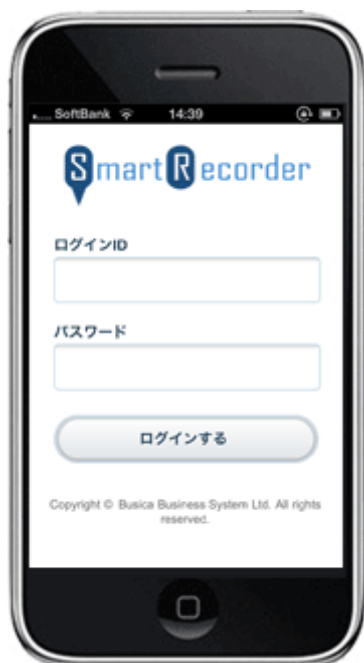
< スマートフォンログイン画面 >